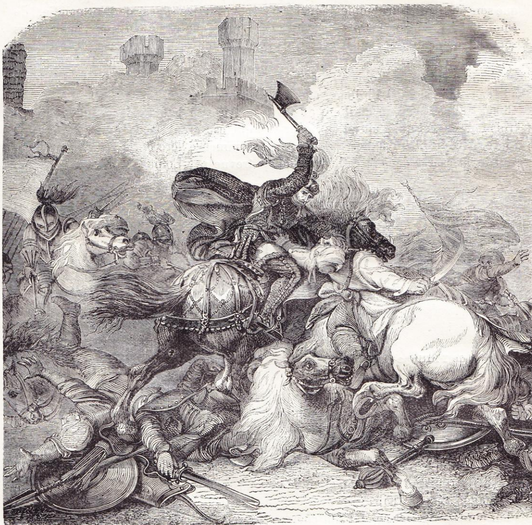
Richard Cœur-de-Lion en Palestine.

gea sous Richard, la Bretagne sous Geoffroy. Le jeune Henri, qui était associé à la royauté, se retira à la cour du roi de France, somma son père d'ab-